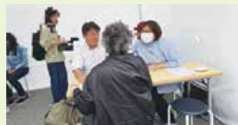
▲浦野も毎回、相談員として参加しています

元職場である中野共立病院・診療所の有志スタッフが毎月第4木曜日に中野駅北口で「なんでも相談会」をおこなっています。お一人で抱え込まず、お気軽にご相談ください。