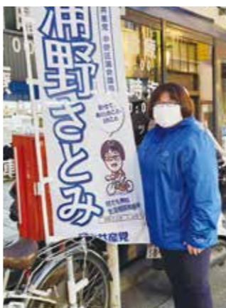
▲朝は中野駅北口・新井薬師前駅・沼袋駅で、夕方は新井薬師前交差点・薬師あいロード入口などで、定例宣伝をおこなっています。お気軽にお声がけください。