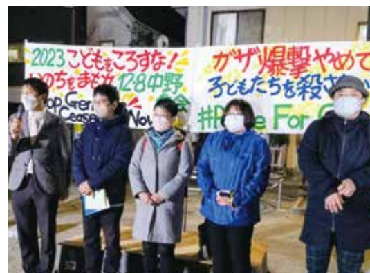
▲2023年12月8日 中野区内での集会・デモに日本共産党議員団全員で参加

※停戦を求める主旨の「意見書」や「決議」を可決した地方議会は、75になりました(2023年12月18日時点)