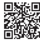
▲区民アンケートへのリンクQRコード

9月からお配りしている「中野区民アンケート」には、10月30日現在で4000人以上の方から返信をいただいています。議会論戦などに活かすとともに、今後結果も報告いたします。まだご回答いただいていない方はこちらのQRコードを読み取り、回答する事ができます。