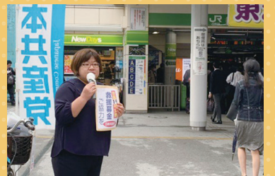
▲街頭にて台風19号救援募金の訴え