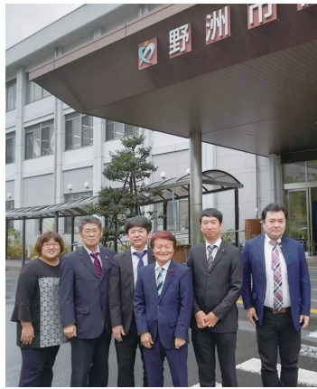
▲10/18 野洲市役所前にて