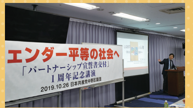
▲10/26 ジェンダー平等学習会