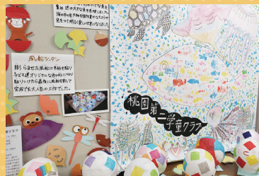
▲昭和・新井の各地区まつり