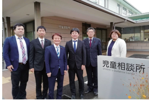
▲10/17 静岡市児童相談所にて

静岡市では、児童相談所・里親家庭支援センター・里親会の取り組みを（里親委託率は新潟市に次いで全国2番目）、また、「市民に寄りそう行政」として全国的に有名な野洲市では、債権管理条例・くらし支えあい条例について視察。中野区に活かせることが沢山ありました。詳しくは私のブログで紹介しています。