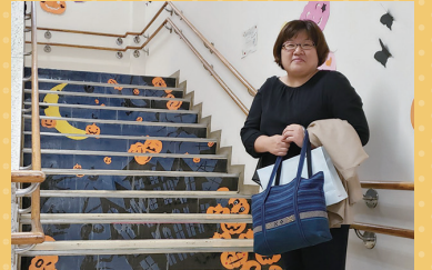
▲10/19 障害者会館まつり