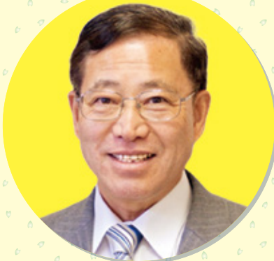
都議会議員 植木こうじ