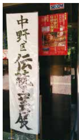
▲中野区伝統工芸展(6/3、4、5)