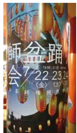
▲新井薬師盆踊り大会(7/21、22、23)