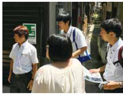
▲京都市「防災まちづくり推進事業」