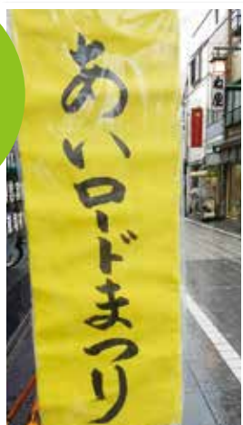
▲あいロードまつり(8/20、21)