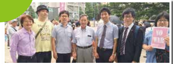
▲戦争しない政治を求める中野デモ(6/19)